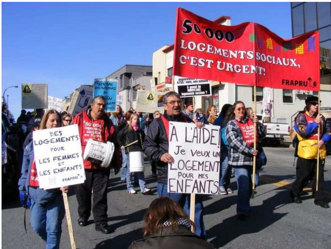
Manifestation du 5 octobre 2011 à Rouyn-Noranda